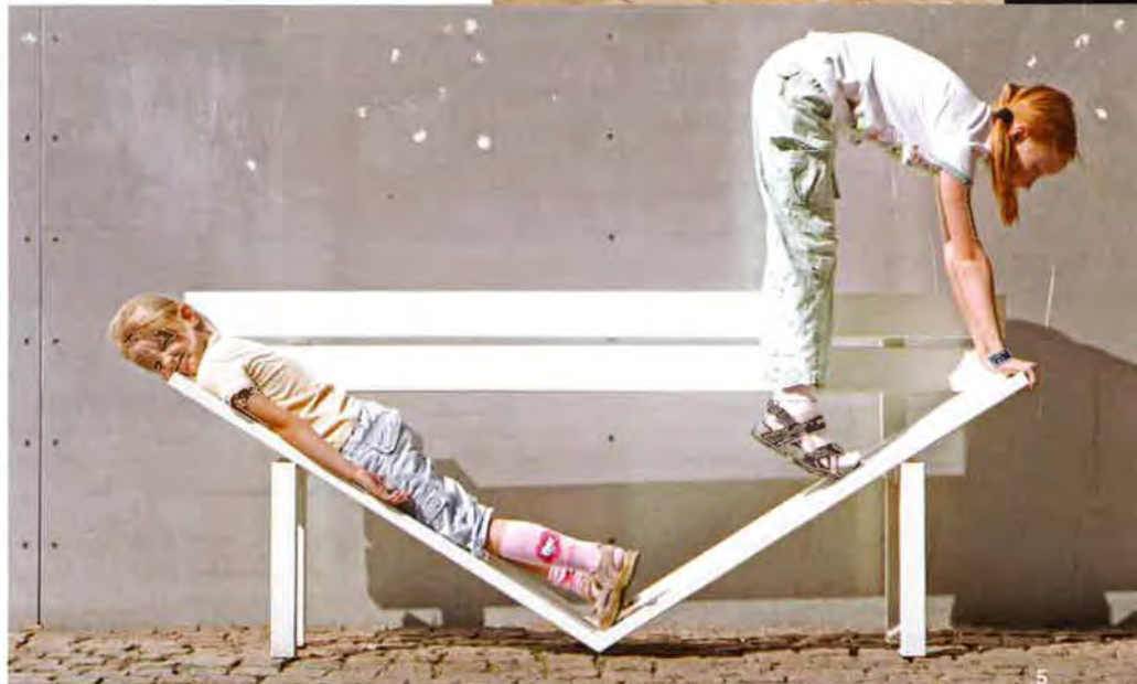
1, 5. Modified Social Benches 1-10 (2005 г.), показани в Хелзинки, 2006 г.