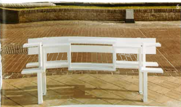
3. Modified Social Benches L-U (2008 г.), показана в Берлин, 2010 г. Modified Social Benches L-U (2008) exhibited in Berlin, 2010. 4, 5, 6. Modified Social Benches L-U (2008 г.), показани в Де Хаан Вендуин, Белгия, 2012 г. Modified Social Benches L-U (2008) exhibited in De Haan Wanduine, Belgium, 2012.

концептуалното изкуство от 70-те години. Работите му често представят изненадващи елементи, които поставят зрителя в центъра на събитието и се фокусират върху неговите преживявания, възприятия и реакции. За последните десет години Хайн е осъществил над 50 самостоятелни изложби в цял свят. Работите му са в колекциите на редица престижни музеи като лондонската Tate Gallery, Centre Pompidou в Париж и Музея за съвременно изкуство MOCA в Лос Анжелис. Останалата част от сериите Modified Social Benches и други проекти на Йене Хайн може да видите на www.jeppehein.net . ■